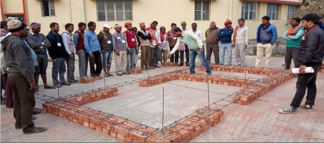
Mason Training on 18-24 January 2019 at Nalanda District